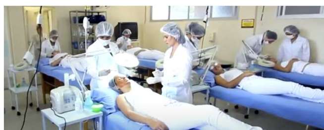
Figura 1 – Ambiente de Práticas da Clínica de Estética do UNESC

A Clínica de Estética do Centro Universitário do Espírito Santo - UNESC é um ambiente de práticas acadêmicas necessário para a formação do Tecnólogo em Estética e Cosmética. Nos últimos semestres do Curso, nas disciplinas Práticas Integradoras, as alunas desenvolvem suas habilidades técnicas realizando diversos procedimentos capilares, faciais e corporais em pacientes que buscam a resolução de sua queixa estética.