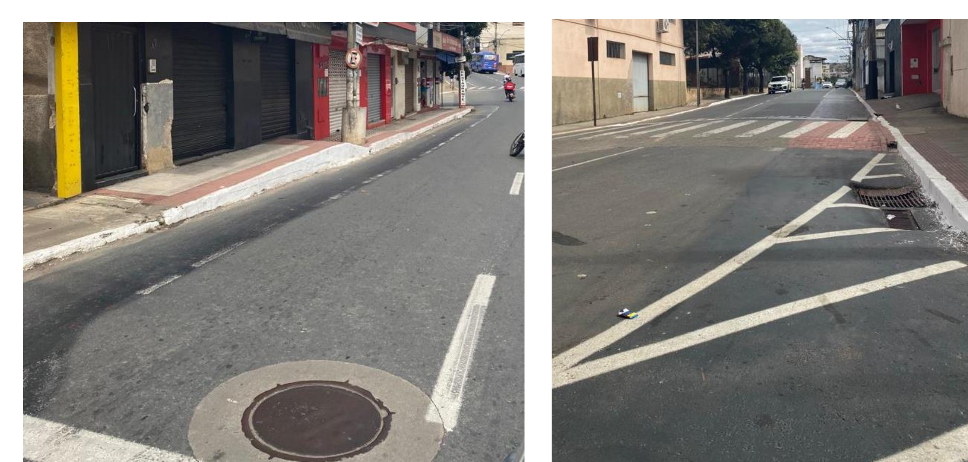
Ciclofaixa que voltou a ser estacionamento e pista para veículos na Av. Silvio Ávidos.