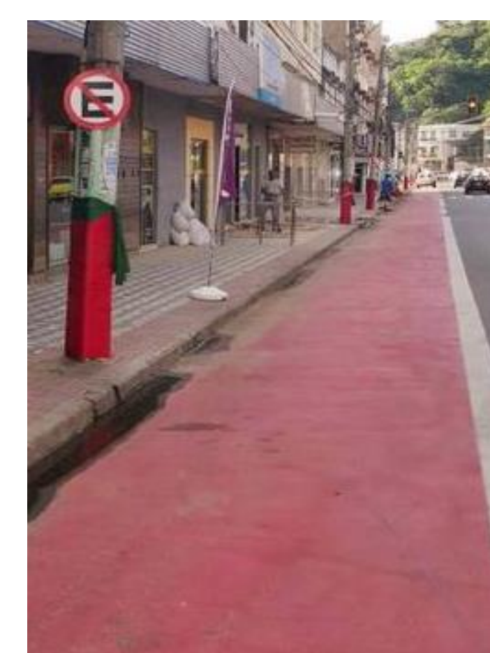
Ciclofaixa na Av. Silvio Ávidos- São Silvano Colatina.