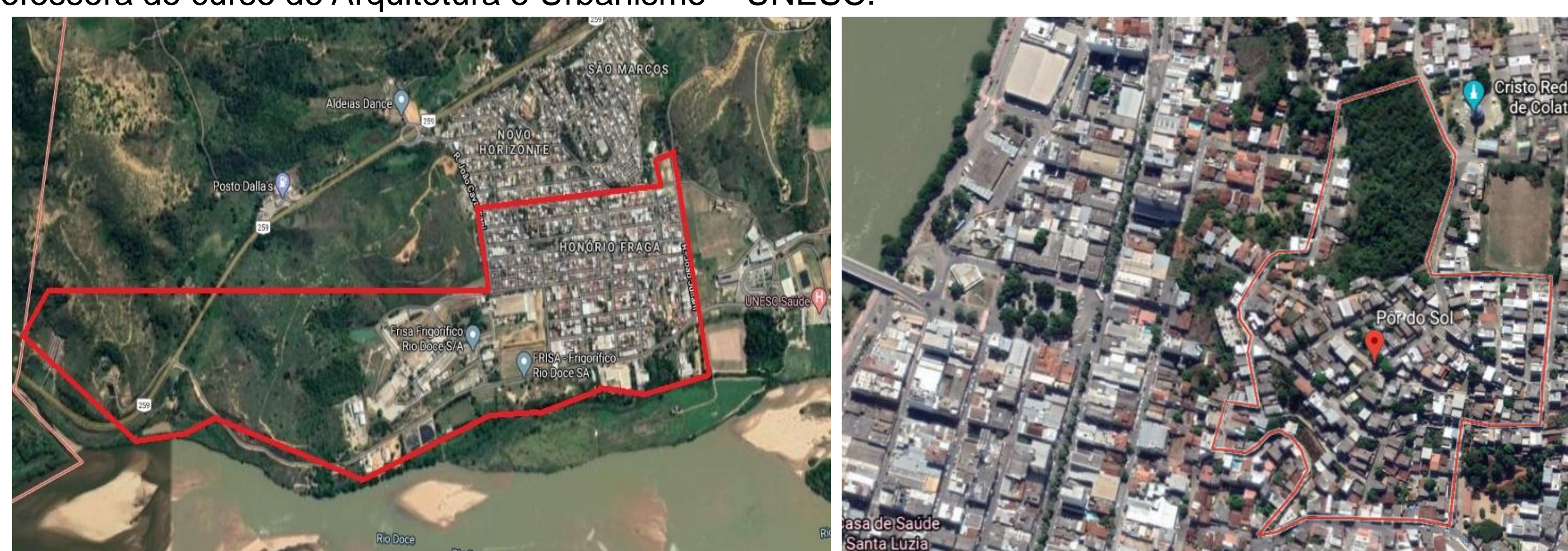
Figura 1 – Delimitação da expansão territorial do bairro Honório Fraga e respectivamente do bairro Pôr do Sol.

BRAGA, Roberto. A cidade: espaço da cidadania . São Paulo: 2004. 18 p.